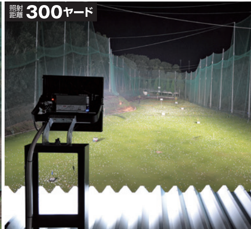
沢田ゴルフ練習場様(静岡県沼津市) 8灯設置

※照度は中心照度による当社実測値のため、使用環境下により異なります。 ※球寿命は光束が70%に低下するまでの時間です。表示は設計値であり、製品の寿命を保証するものではありません。 ※LEDにはバラツキがあるため、同一型式製品でも発光色や明るさが異なる場合があります。 ※必ずアース(接地)をしてください。