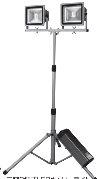
三脚2灯式LEDキャリーライト CL-30LW-CH