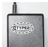
リチウムイオンバッテリー