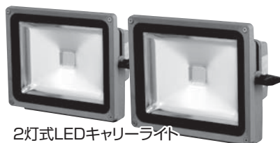
2灯式LEDキャリーライト CL-30-W-CH

ご使用前に、この取扱説明書をよくお読みいただき、本器の性能を充分にご理解の上で、適切な取り扱いと、保守をしていただいで、いつまでも安全で能率良く、お使いくださるようお願いいたします。